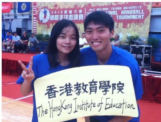
我們的義工 – 芳印

這是我第二次參與臺灣大學國際手球邀請賽,出發前收到了比賽賽程,外隊有日本的名古屋大學及新加坡管理學院,他們更是首次參與這盛事,這使我的心情又緊張,又興奮。